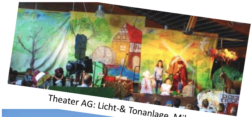
Theater AG: Licht- & Tonanlage, Mikrofone

Weetfelder Straße 1 59199 Bönen Telefon: 02383-913500