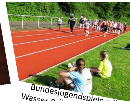
Bundesjugendspiele u.ä.: Wasser & Äpfel zur Stärkung, Medaillen & Urkunden