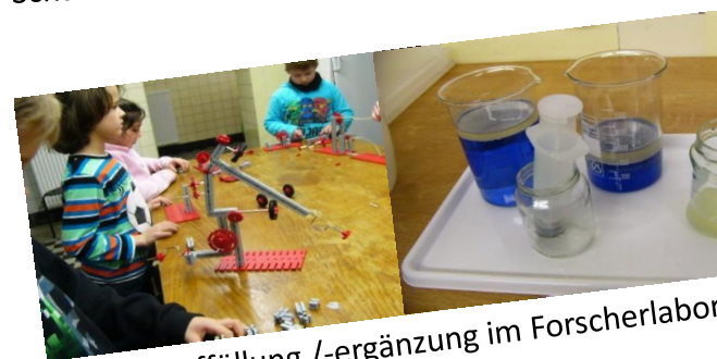
Materialauffüllung /-ergänzung im Forscherlabor