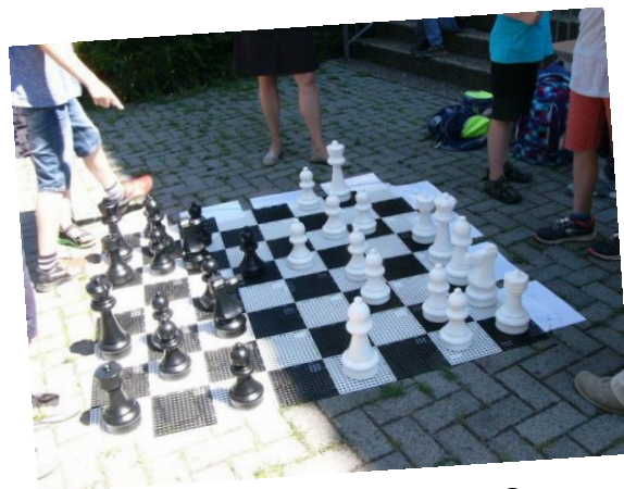
Trainer für die Schach AG & Outdoor-Schach