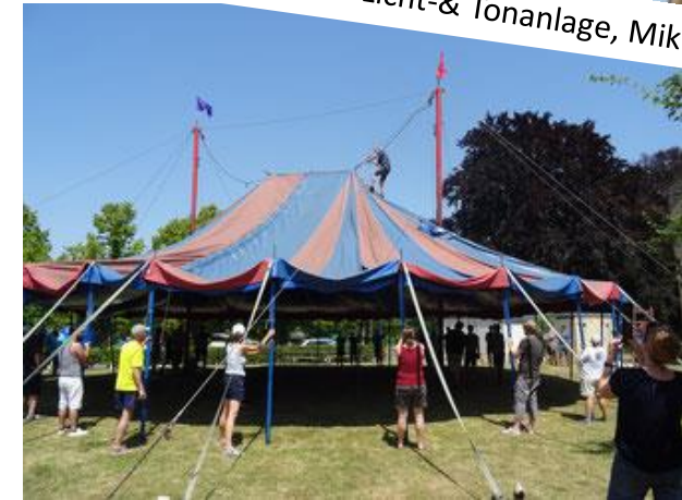
Zirkusprojekt: Auf-/Abbau & Vorfinanzierung