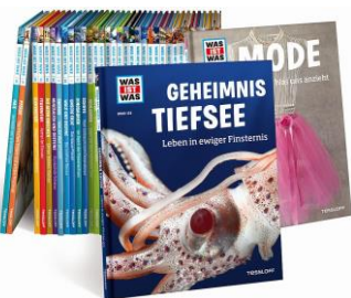
Regelmäßiger Nachschub für die Schulbücherei