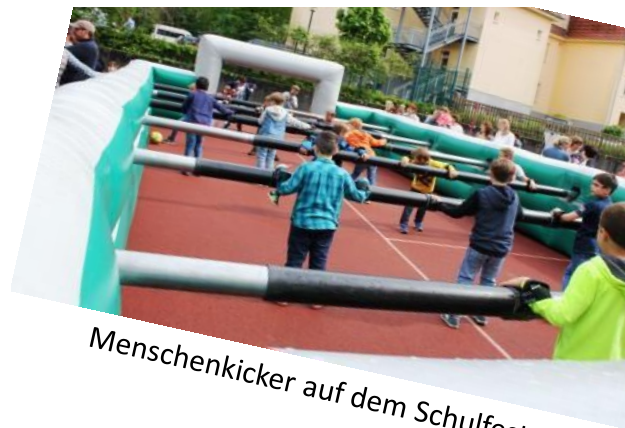
Menschenkicker auf dem Schulfest