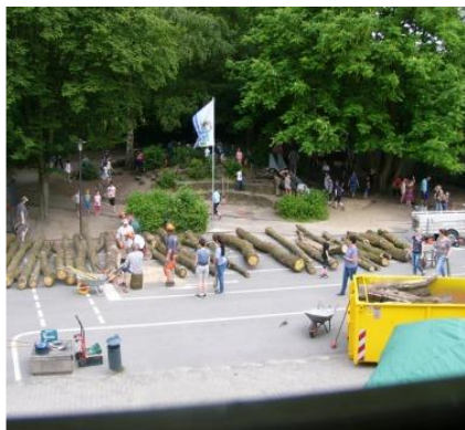
Sanierung Schulhofspielgeräte: Holz erworben & mit angepackt