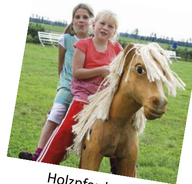
Holzpferd als Pausenspielgerät