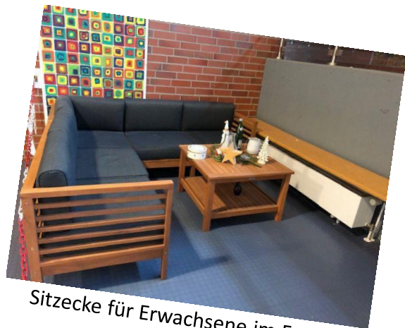
Sitzecke für Erwachsene im Forum