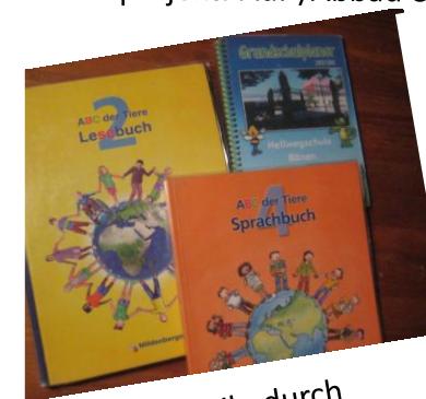
Vorteile durch Sammelbestellung